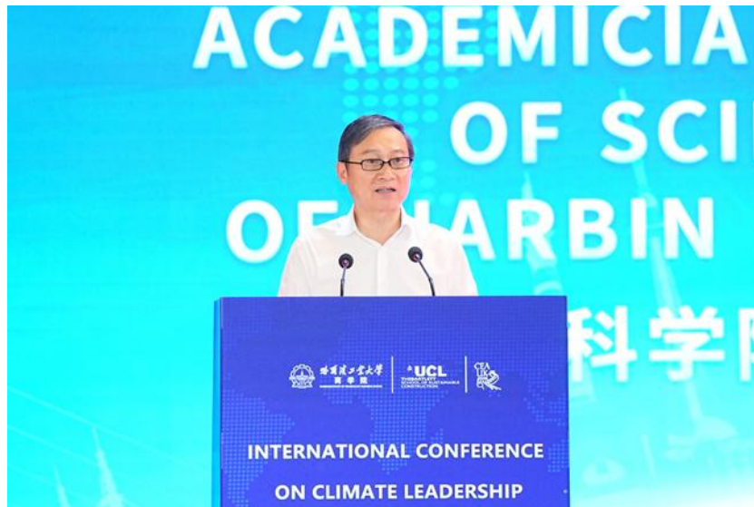
哈工大校长韩杰才院士致辞