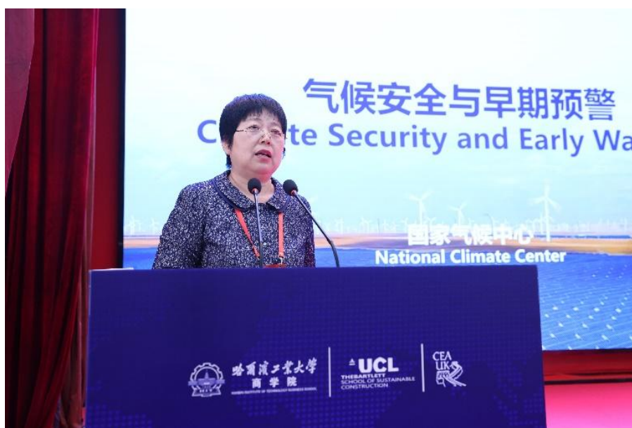
国家气候中心副主任袁佳双致辞