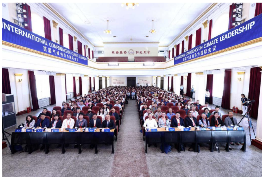
首届气候领导力会议开幕式

会议由哈工大商学院、UCL、CEA (UK/Europe)共同主办，吸引了来自中国、英国、西班牙、澳大利亚等国家和相关国际组织、国内外学术期刊 200 余名专家学者参会。